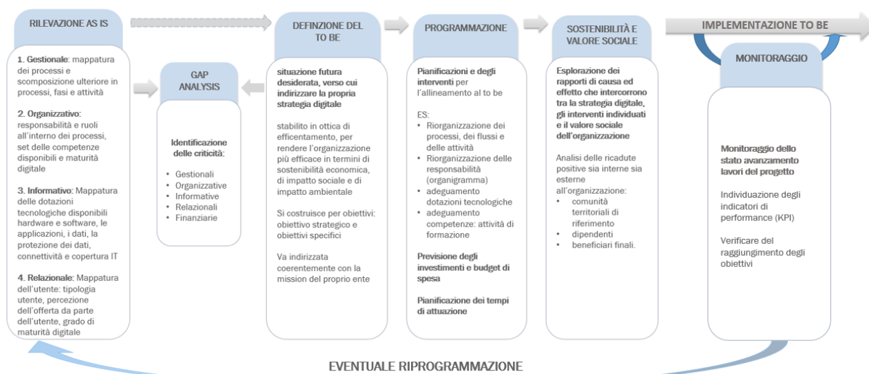
Figura 2 Approccio metodologico